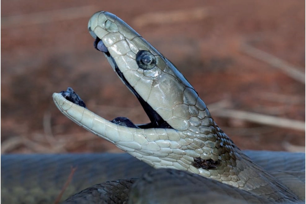
Dendroaspis polylepis (Black Mamba) from near Louis Trichard, Limpopo.