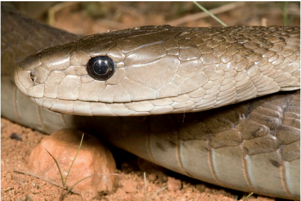
Black Mamba (Dendroaspis polylepis) from Nelspruit, Mpumalanga with a coffin-shaped head.