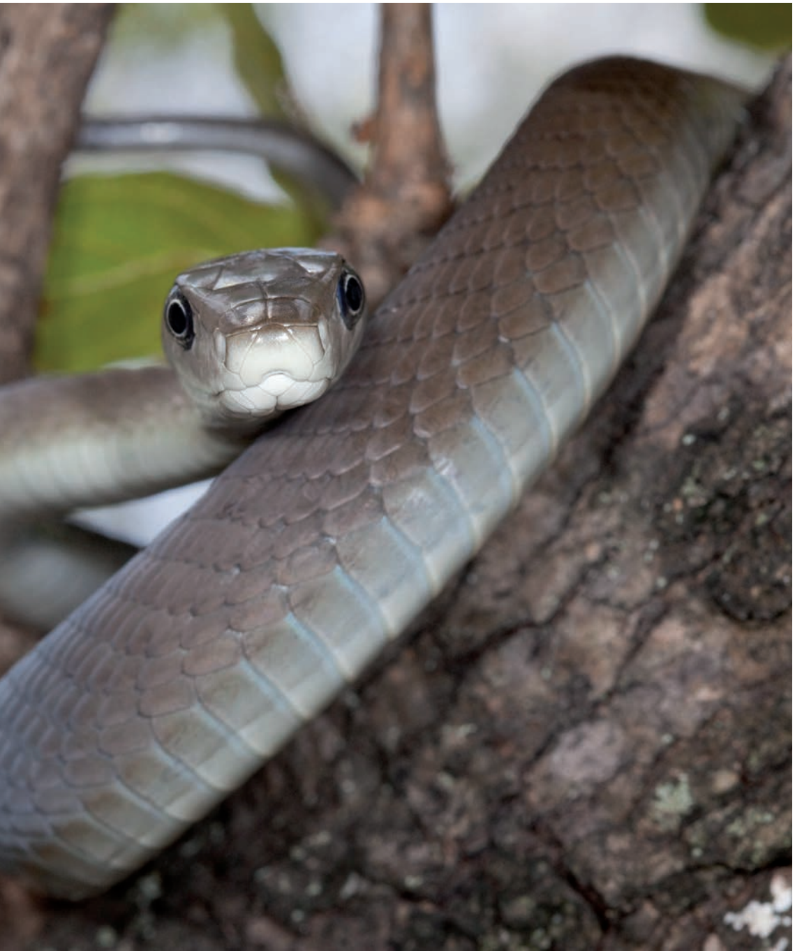
Black Mamba (Dendroaspis polylepis) - juvenile near Hoedspruit, Limpopo.