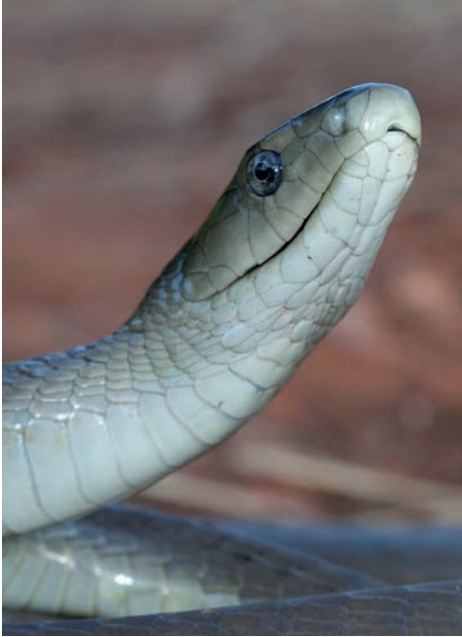
Dendroaspis polylepis (Black Mamba) from near Louis Trichard, Limpopo.