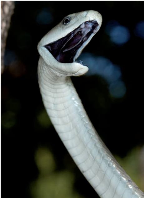
Black Mamba ( Dendroaspis polylepis ) from Hoedspruit.